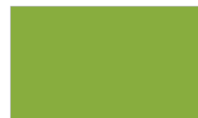
Verde Alface S606