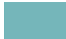
Azul Ciano S513