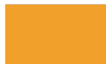
Amarelo Carregado P100