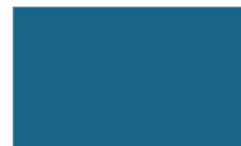
Azul Polícia P502