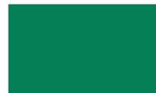
Verde Normal S613